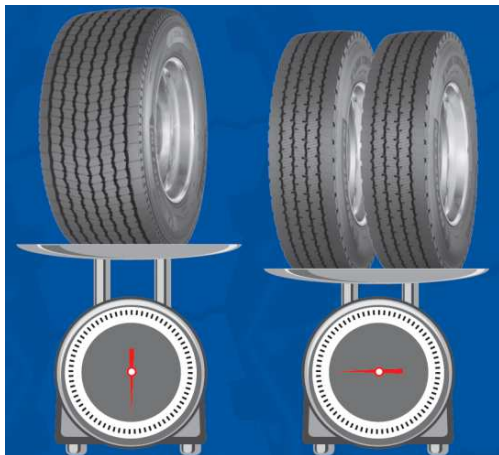
（軽量化のイメージ画像）

ダブルタイヤ仕様と比較しタイヤ・ホイールユニット総幅が縮小されるため、左右タイヤ間距離が増大しシャーシ設計の自由度が拡大します。また、タイヤのシングル化により部品点数が減り、車両の生産性向上にもつながります。