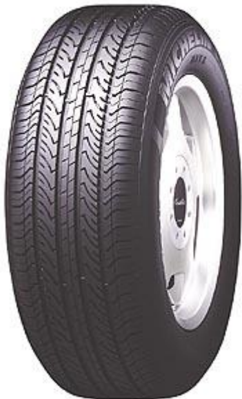
「Michelin Energy MXV8（ミシュラン・エナジー・エムエックスブイエイト）」

日本ミシュランタイヤでは「Energy MXV8」を新車装着用タイヤとして2003年度中に日本の自動車メーカーからの認証を取得すべく作業を進めていくとともに、静かで快適なドライビングを求めるドライバー向けにリプレース市場でも積極的に販売していく意向です。